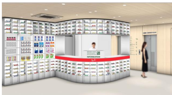
1F インフォメーション