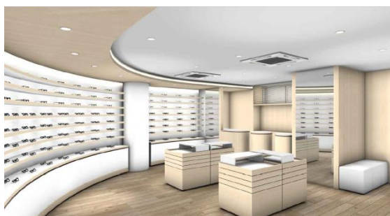
2~4F メガネ・サングラスフロア