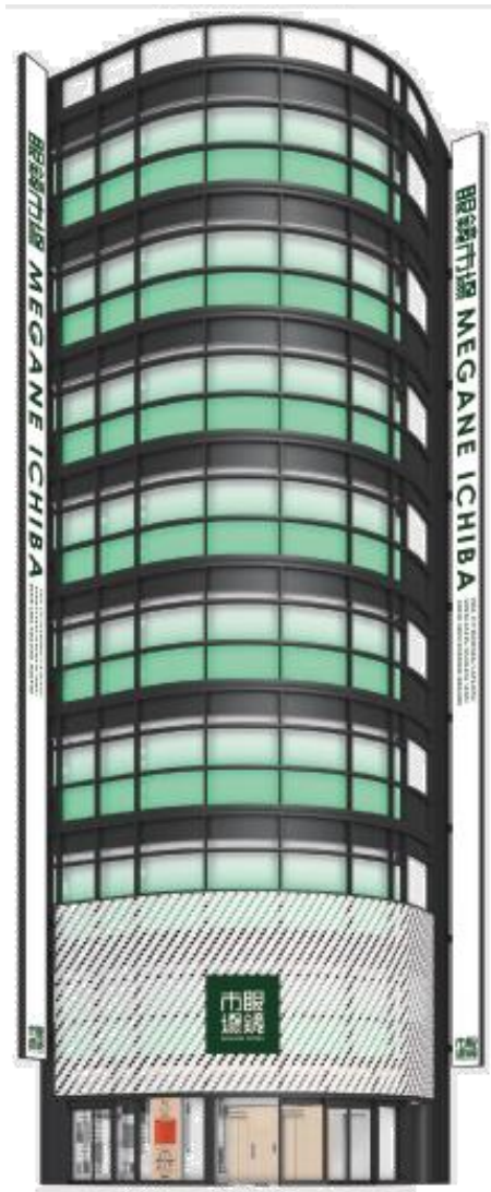
新宿東口本店 外観