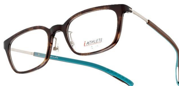
左：「フレキシブルモダン」採用 IA-472（ブラック）